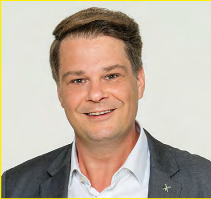
MIRKO ROHLOFF FRAKTIONSVORSITZENDER