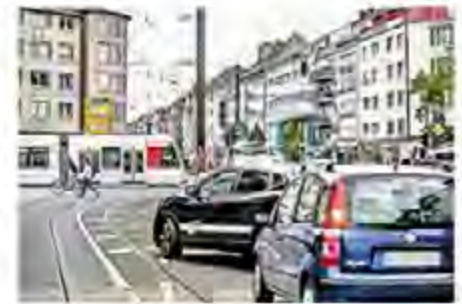
Die FDP will die Grüne Welle für Autos zurück.

DÜSSELDORF Die FDP hat ihr Wahlprogramm in einem Zehn-Punkte-Plan für Düsseldorf poliert. Ganz oben auf der Liste der Liberalen steht wieder mehr freie Fahrt auf der Autobahn.