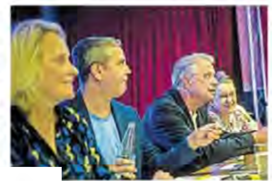
Beim Parteitag der FDP in Düsseldorf...